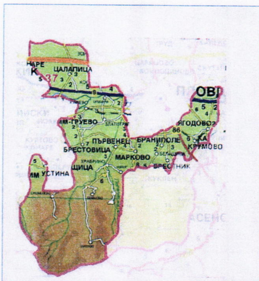
Фиг.2- Разположение на населените места в община Родопи

На фиг.1 и фиг.2 са показани местоположението на община Родопи сред общините на пловдивска област и разположението на населените места в общината.