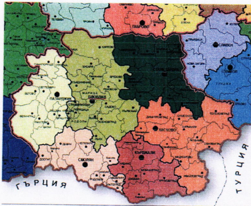
Фиг.3- Разположение на областите и общините в Южен централен район за планиране

По отношение на разположението на административния център на общината, разстоянията от него до някои от по-големите градове в страната съвпадат напълно с разстоянията до същите градове от гр. Пловдив.